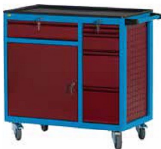
W93 CD2 A26