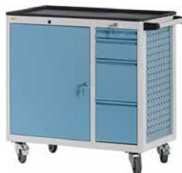
W92 C28 A26