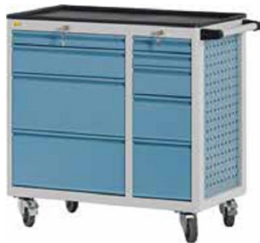
W92 C26 A22