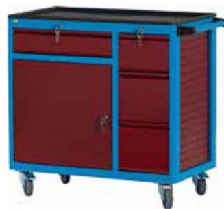
W93 CD2 A27