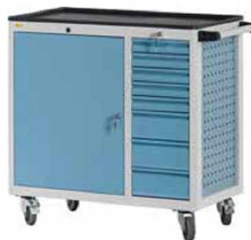
W92 C28 A04