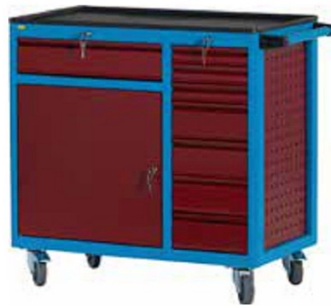
W93 CD2 A05