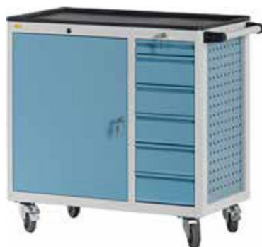
W92 C28 A06