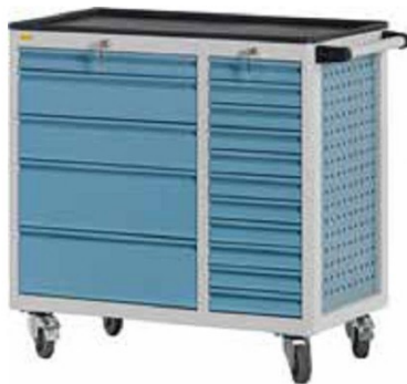
W92 C14 A01