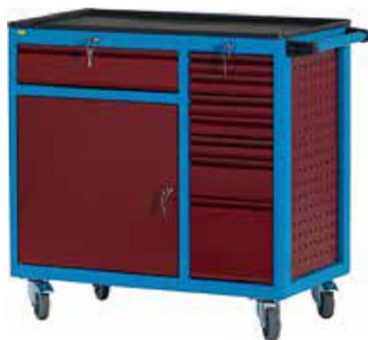
W93 CD2 A18