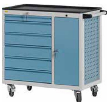
W92 C06 A28