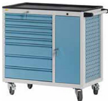
W92 C04 A28