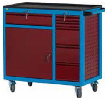
W93 CD2 A15