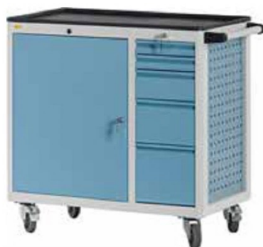
W92 C28 A22