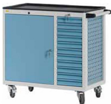
W92 C28 A01