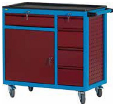
W93 CD2 A16