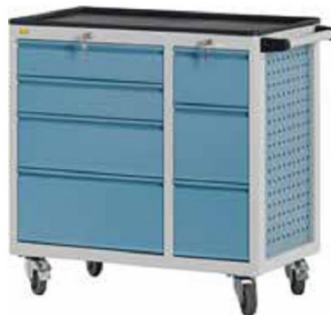
W92 C23 A27