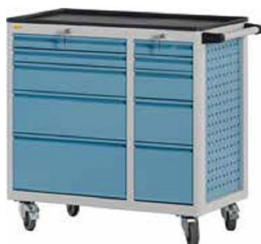
W92 C22 A22